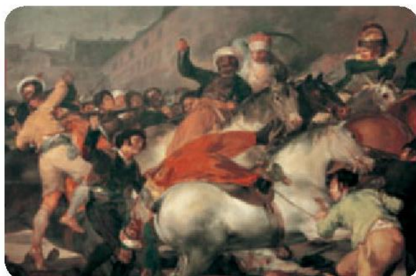
El 2 de mayo de 1808 en Madrid.