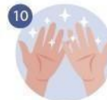
10 YA TENEMOS LA MANOS SÚPER LIMPIAS