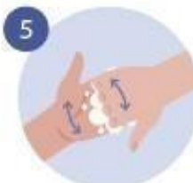
5 FROTAMOS LOS DEDOS, CON LA PALMA CONTRARIA