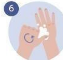
6 FROTAMOS LOS DEDOS GORDOS