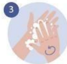
3 EMPEZAMOS A FROTAR, HACIENDO ESPUMA