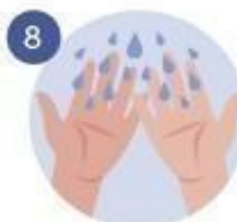
8 NOS QUITAMOS TODO EL JABÓN CON AGUA