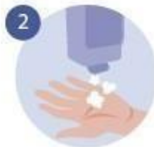
2 DESPUÉS JABÓN