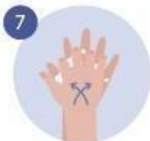
7 FROTAMOS ENTRE LOS DEDOS