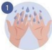
1 NOS ECHAMOS AGUA