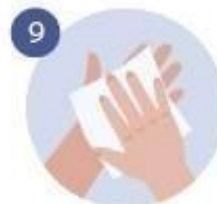
9 NOS SECAMOS BIEN LAS MANOS