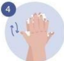
4 FROTAMOS BIEN, POR DELANTE Y POR DETRÁS